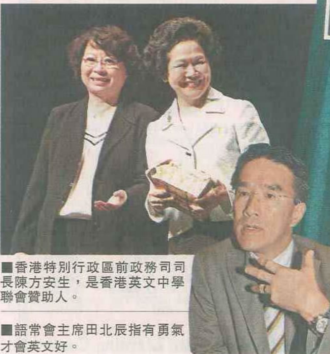
■香港特別行政區前政務司司長陳方安生，是香港英文中學聯會贊助人。

「學英文不要怕面懵，怕人笑就學不到英語。」他又笑指自己性格較拘謹，所以讀書時代甚少參演話劇，現時回想也感後悔。「識做戲的人較生鬼，性格也放些。」