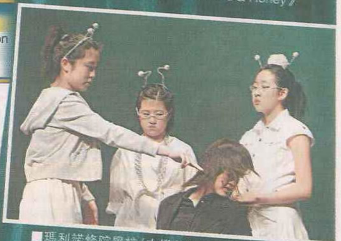
■瑪利諾修院學校(中學部)《The Extra-terrestrial Experience》