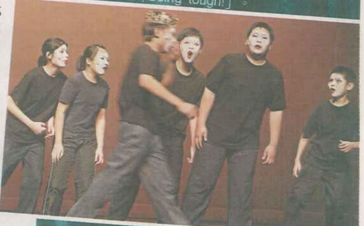
■旅港開平商會中學《Brown Bread & Honey》