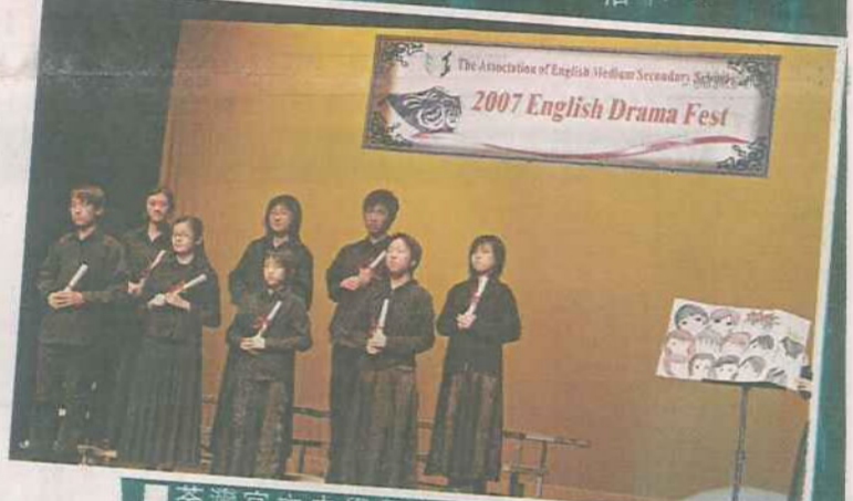
■荃灣官立中學學生，演繹英語版《女王的教室》，教同學要「Being tough!」。