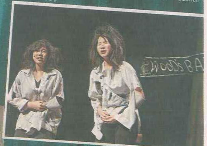
■香港真光中學《The Pie and the Tart》